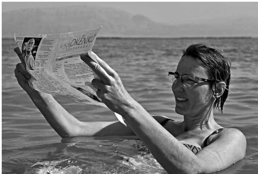
Okénko i v Mrtvém moři