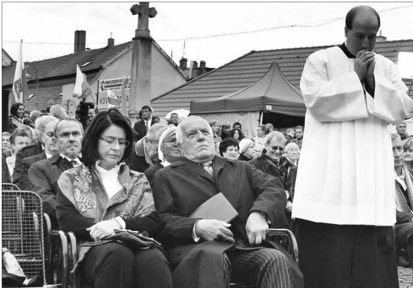
Foto: Eugen Kukla: Svatováclavská pouť ve Staré Boleslavi v roce 2012

i někteří naši lidé. Copak nevidí, že Putin zločinně porušuje Desatero? Zapomněli, že nechával vraždit civilní obyvatele v Čečensku, v Gruzii, své odpůrce a novináře? Nevidí, že na Ukrajině řídí další válku?