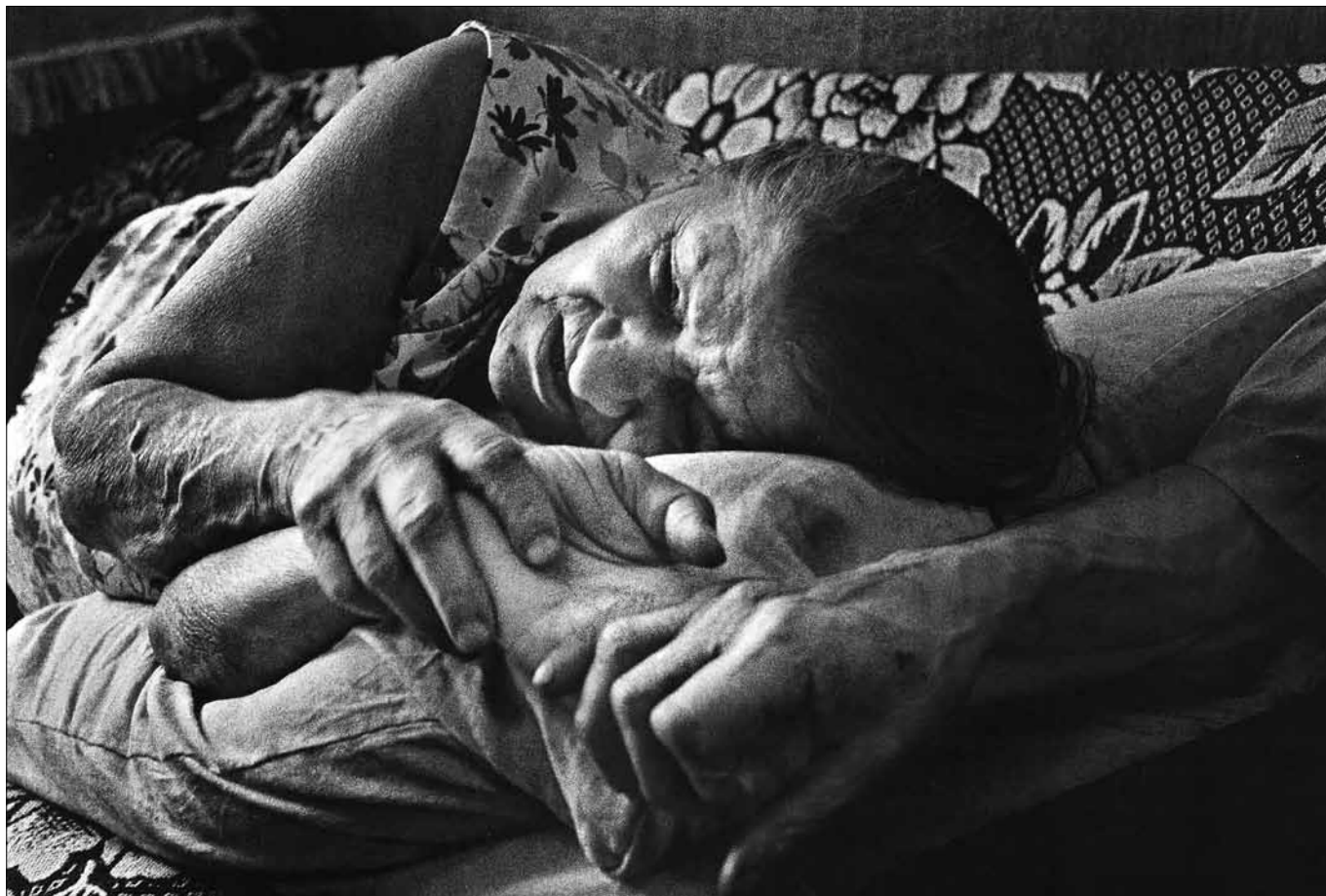
Petr Hruška: Ruce. Ruce staré ženy, krásné a těžké natolik, že je dokáže sevřít jen ruka starého muže.