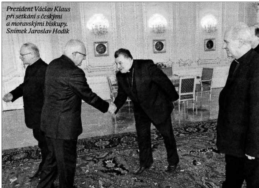
Prezident Václav Klaus při setkání s českými a moravskými biskupy.

Nyní se vracím ke své práci, abych ji dělal, jak to druzí lidé právem očekávají – pořádně a včas. Doufám, že mě v tom chod státu ani společenská situace nevyruší natolik, abych musel pro veřejnost znovu formulovat svůj názor.