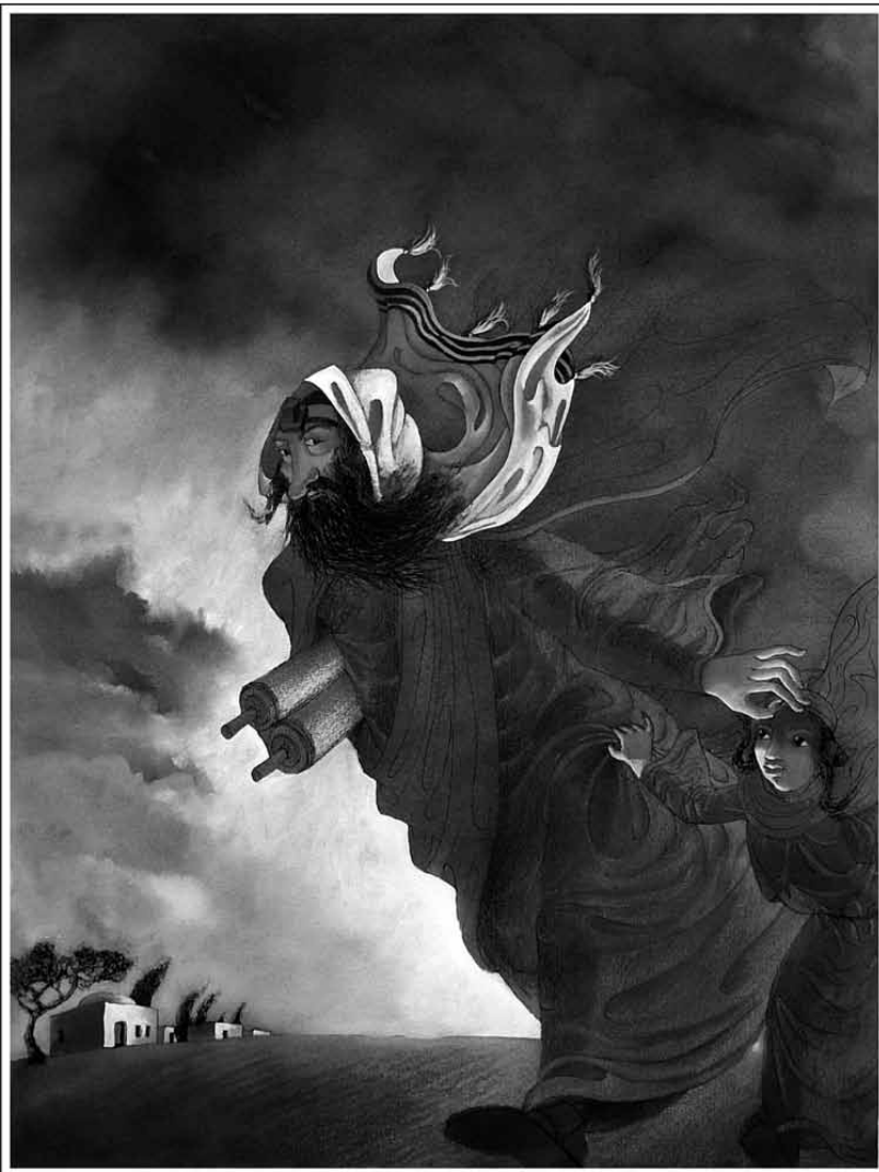
Ondřej Rada - „Josef s malým Ježíšem“, 2012