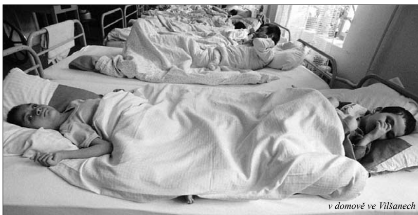
v domově ve Vilšanech