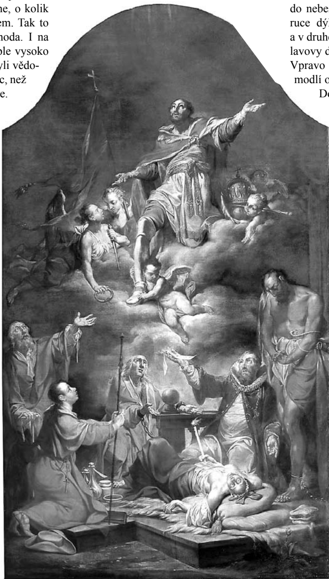
zrestaurovaný obraz sv. Václava