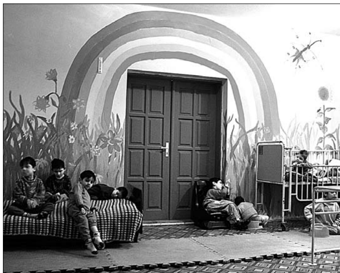
Jan Čanda - U nejmenších dětí

patřila problematická kolektivní péče o malé děti ve formě jeslí. Skandinávský model odpovídá charakteru společnosti, která se tradičně chová zcela jinak, než společnost naše. Lidé jsou tam vzájemně k sobě podstatně vlídnější, což vytváří i příznivější atmosféru pro výchovu dětí mimo rodinu. Víme dobře, že se tam nejen méně krade, ale i méně závidí, méně podvádí a tak dále. Takováto společenská atmosféra u nás chybí.