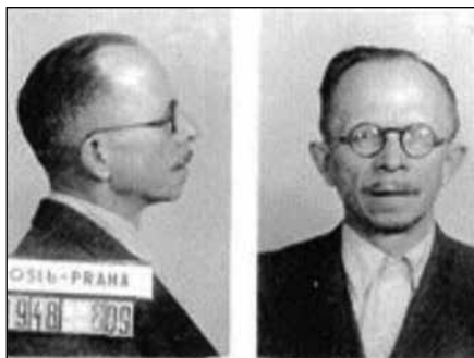
Fotografie Vladimíra Vochoče porízené Státní policií v 50. letech

Za svoji činnost ve Francii obdržel in memoriam čestnou funkci velvyslance, v roce 2000 ho ocenila i OSN, když ho zařadila mezi 84 světových diplomatů, kteří riskovali vlastní život pro záchranu Židů.