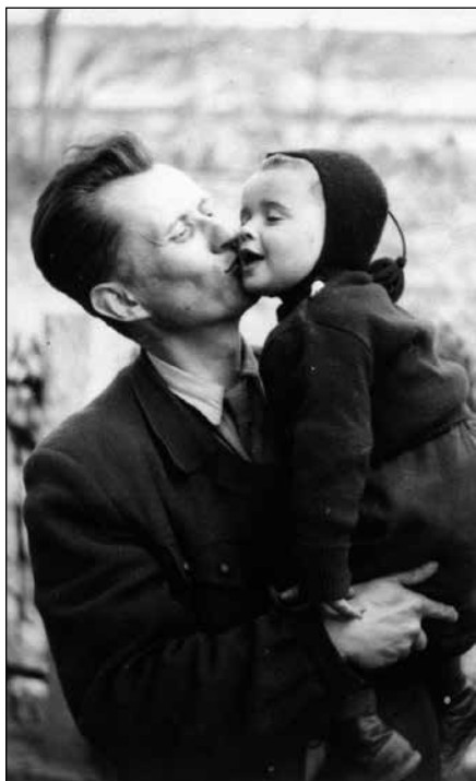
Malý Jan Palach s otcem

Jestli česká inteligence nedá najevo svou sílu - pokud ji ještě vůbec má - a nevyčlení ze svého středu věrohodné, statečné a politicky srozumitelné osobnosti, pak se obávám, že nás čeká dlouhé a temné období. Dosud ještě demokratické strany se každopádně musí otevřít novým členům a své programy tvořit nikoliv pouze s ohledem na nejbližší volby, ale i na delší strategické cíle. Luboš Dobrovský