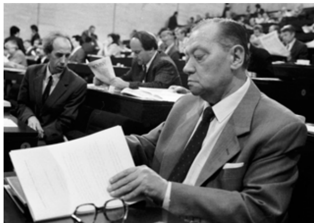
Rudolf Hrušínský, poslanec Federálního shromáždění za Občanské fórum, snímek z roku 1990.

Z opoziční smlouvy jsem byl zklamaný. Nebo z věcí, které se děly na pražském magistrátu i jinde. Ale víte co? Tehdy se kradly „je-