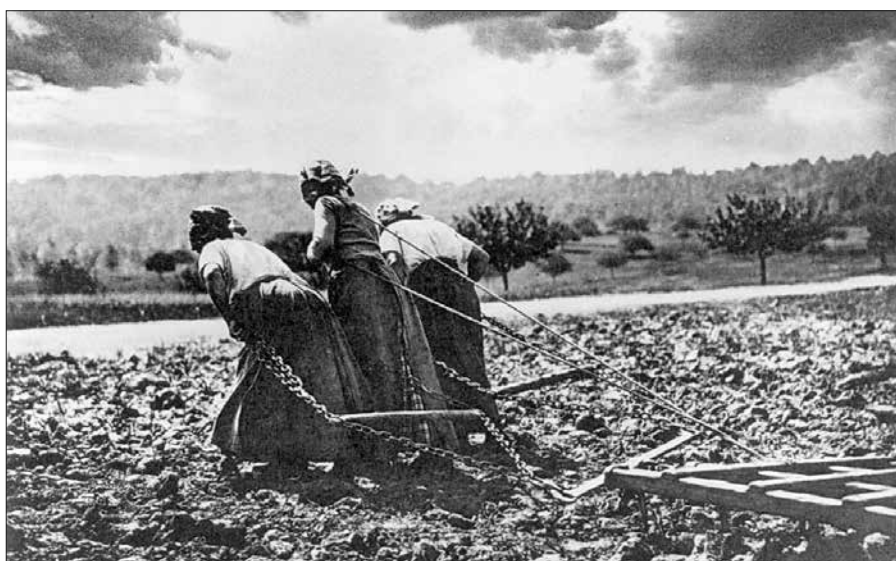
Belgie 1917 (muži i tažný dobytek byli ve válce)