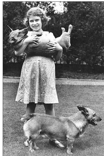
Alžběta princezna 1936