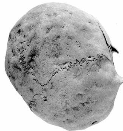
Syfilitická lebka z Lukavice

Potešilo ma publikovanie jeho „bezákovskej“ úvahy v Okénku . Veľmi si cením jeho jasný