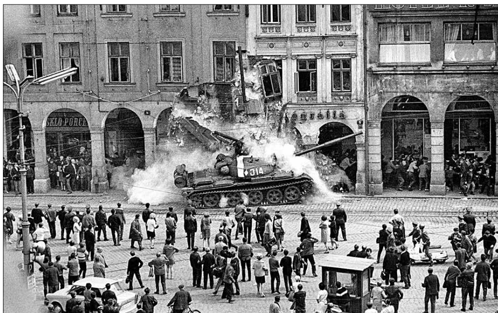
Liberec, srpen 1968