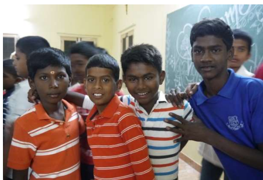
Děti z projektu Adopce na dálku