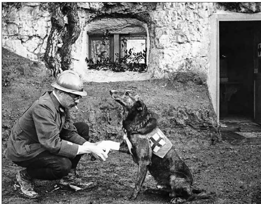
Belgie květen 1917

Jeho báseň se stala jedním ze symbolů celé války a dodnes je připomínána tradicí vlčího máku na paměť padlých a válečných veteránů. Hlavně v Anglii a Francii je každoročně 11. listopadu v Den válečných veteránů zastaven téměř veškerý život a tento den je vzpomínkou na padlé z první světové války. John McCrae zahynul na pneumonii 28. ledna 1918.