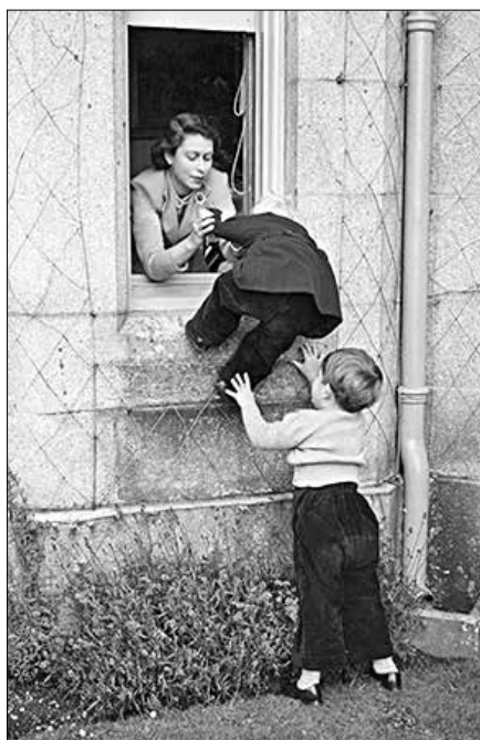
Anglická královna se svými dětmi

mají děti, které to prostě neřeší! Pro Martínka bylo hlavní, že tu maminka je, že k ní může kdykoli přijít a třeba i zalézt k ní do postele nebo si postěžovat na moc přísného tatínka. Postupně jsem se ho snažil připravovat na maminčin odchod, ale většinou mě s dětskou prostotou přesvědčoval, že si tu maminku necháme. Naopak, když jsem se někdy rozplakal, utěšoval mě, že „to bude dobrý“ a že to „zvládneme“ (tak jak to dříve slyšel ode mě). Pondělní večerní dlouhá návštěva paní doktorky a sestry z hospice potvrdila, že Lenka již skutečně umírá. Mezi jednou a druhou hodinou v noci se mi zdálo, že Lenka dýchá opět jinak. Když jsem se ráno po šesté vzbudil, najednou se mi do pokoje k Lence vůbec nechtělo jít. A hned po příchodu mi bylo jasné, že zemřela. Spíš bych to formuloval tak, že již odešla a zanechala po sobě tu skořápku, která ji navíc v posledních měsících hodně potrápila.