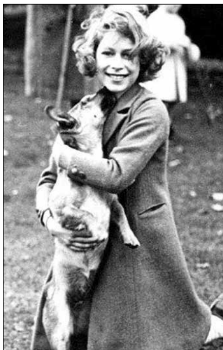
Anglická královna ...

Vrůstám do života stále hloub stále šíře netrvalý sleduji očima oblaka a silněji miluji zemi po které šlapou lidská chodidla Tadeusz Rózewicz