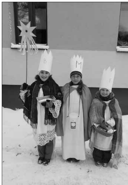
KOLEDNÍCI V LETOHRADĚ